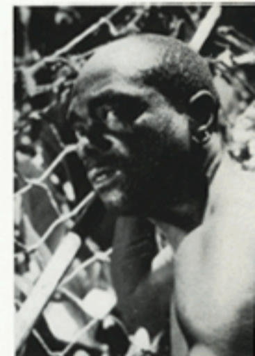
WAAR de zichtbaarheid is beperkt, spelen lans en net toch nog hun rol.