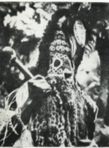
ZO dragen de besnijders op hun maskers de neushoornvogel.

zo dicht dat alle leven al ander leven doorkruist.