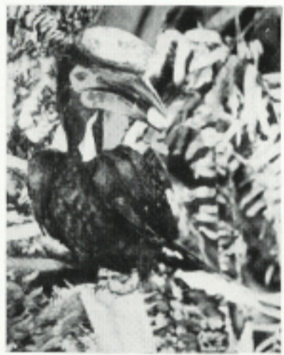
De neushoornvogel die zijn vrouw inmetselt, is het symbool van de mannelijkheid.