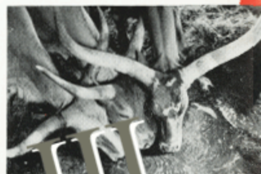
HIER werd de... enmaker en bez... het lot.