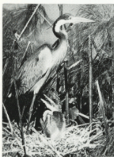
Zwartkopreiger verdoken in de papyrussen.

HIER in de grootse open ruimte is ver zien alles. Vluchten, vliegen of schuilen zijn de kunst.