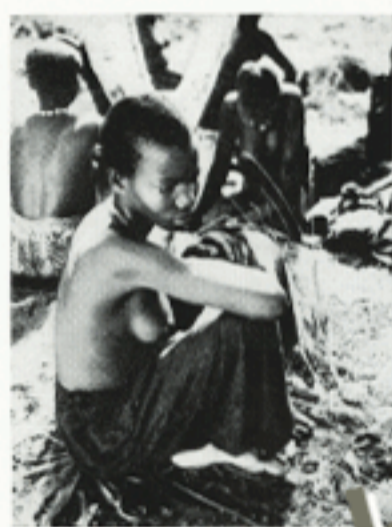
De jong. m... van h... u... me...