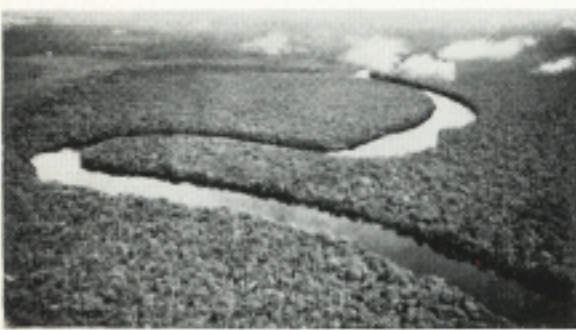
Een woud zo groot als continentaal Europa, van Oostenrijk tot Portugal.