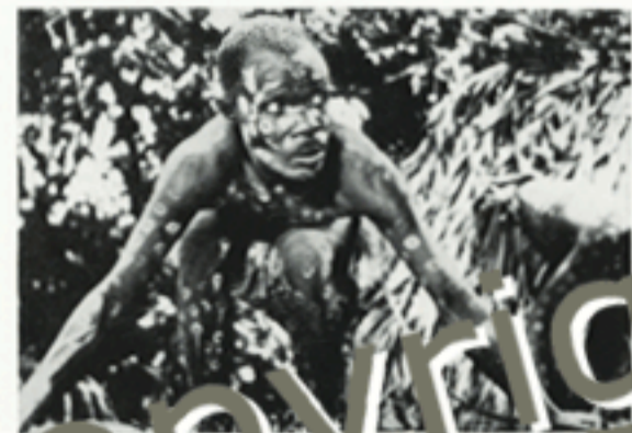
Het woud weer halt van verzoeken, gezang, aler de jacat woelt ingezet.