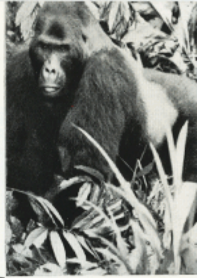
Meestal onzichtbaar, eens ontsluit de gorilla het geheim van zijn groepsleven. De grote stamvader heerst over de bende als een opperhoofd.