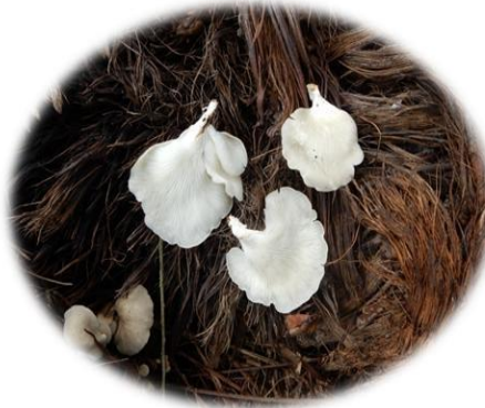
Pleurotus flabellatus pleurotes Kpatra (Bété) Kpèsrin Gban)