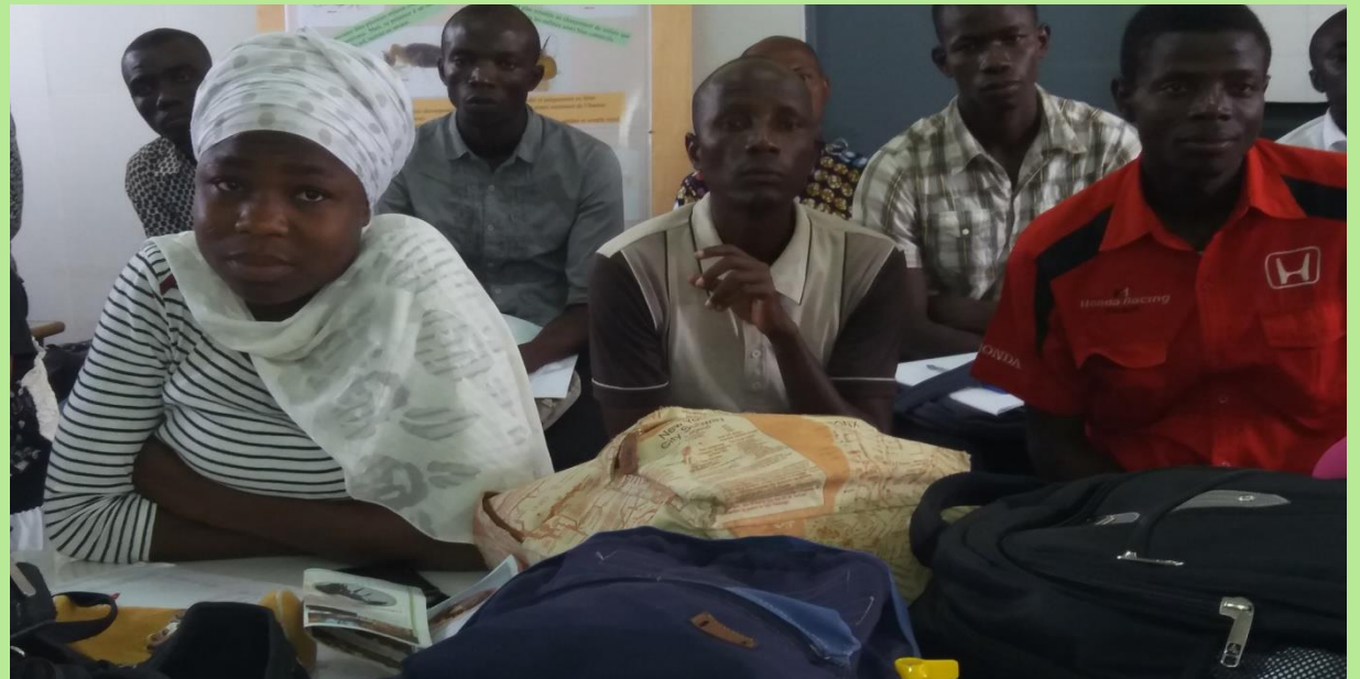
Posters de sensibilisation