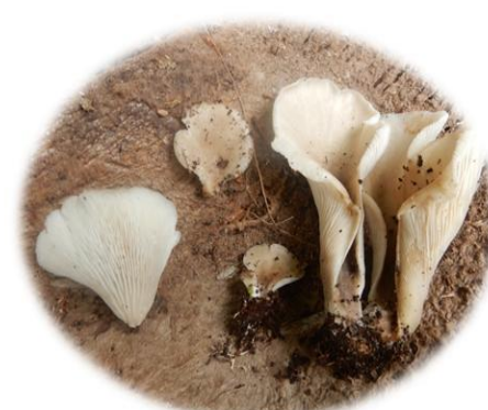
Hohenbuehelia cf. aurantiocystis Kpatra (Bété) Kpèsrin Gban)