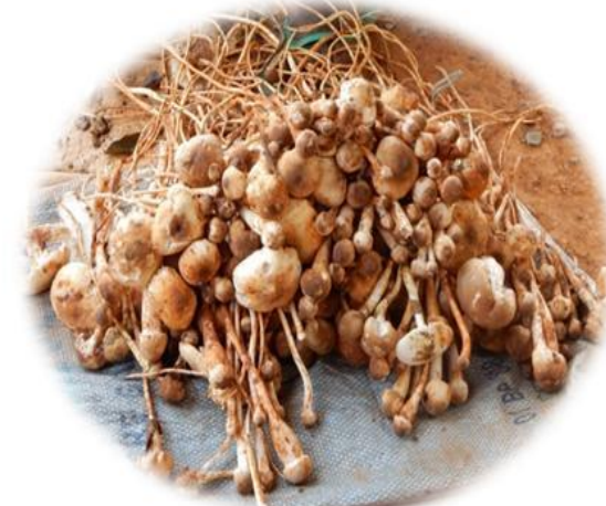
Termitomyces letestui champignons de termitières Trogblé (Bété) Bôtôh (Gban) N'glo (Baoulé)