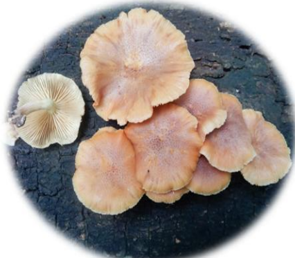
Gymnopilus zenkeri dabadjrè (Bété) Yéréyé Gban) Roudou lèbé( Abidji)