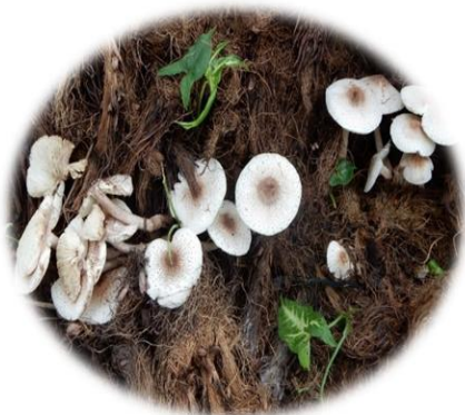
Leucoagaricus americanus Faux-faux Blayèrè (Bété) Akouatika N'dré (Baoulé)