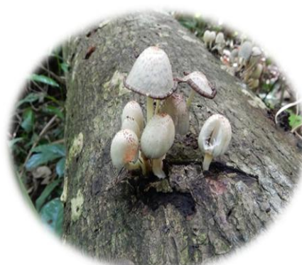
Coprinus sp. Sahangnan (Gban)