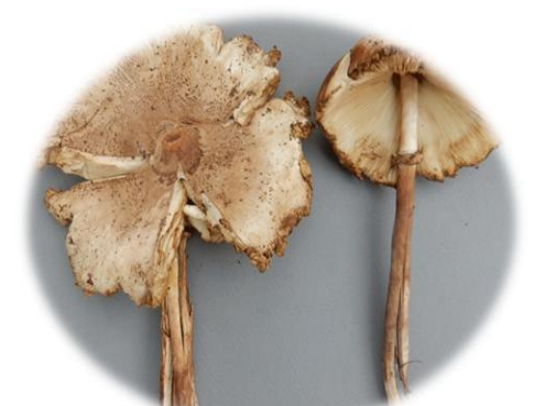
Macrolepiota dolichaula Troglé popa (Bété) Pôpôgoua Gban)