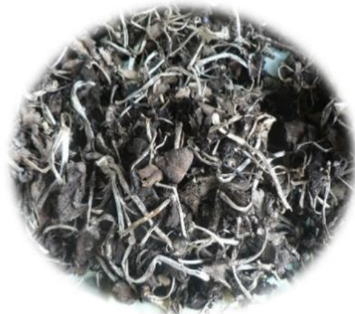
Psathyrella tuberculata champignons noirs Kpatro (Bété) Kpôtro 'Gban) N'dré blé (Baoulé)