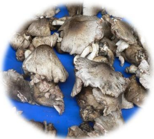
Volvariella volvacea champignons de palmier Kpôlor (Bété) Bôlor (Gban) N'dré Boyéfê (Baoulé)