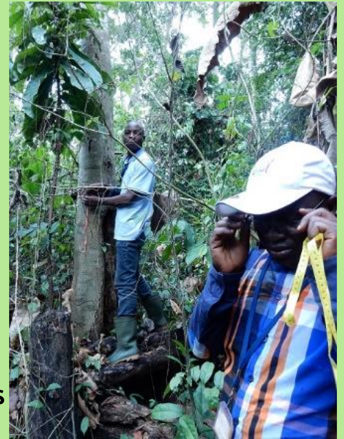
Mesure de la circonférence des espèces ligneuses