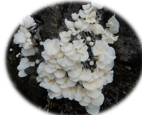
Marasmiellus inoderma Gardjia (Bété) Kpèsrin (Gban)