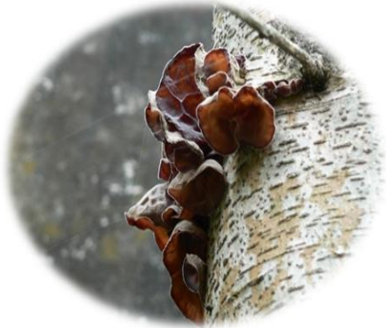
Auricularia cornea oreille de judas Youclitratra (Bété) Bagô toh (Gban)