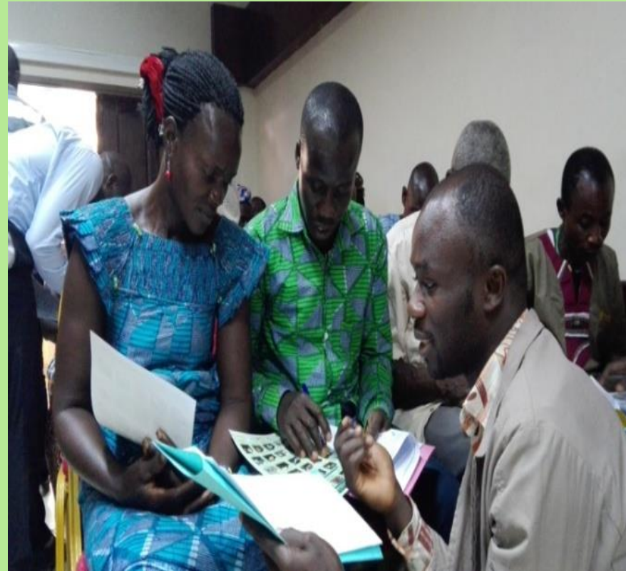
EXERCICES PRATIQUES SUR LA DETERMINATION DES CHAMPIGNONS