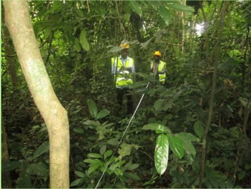
Mise en place de parcelle de relevé