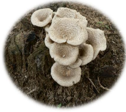
Lentinus squarrosulus Indépendance Gômé (Bété) Nanbènkpiàn (Gban)