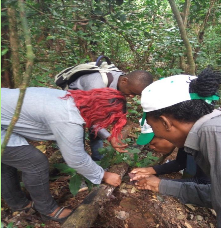
RÉCOLTE DE CHAMPIGNONS SUR LE TERRAIN