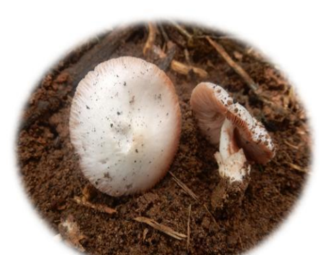
Volvariella earlei Loolia (Bété) Bôlor gbé (Gban) Boyéfè ouffoué