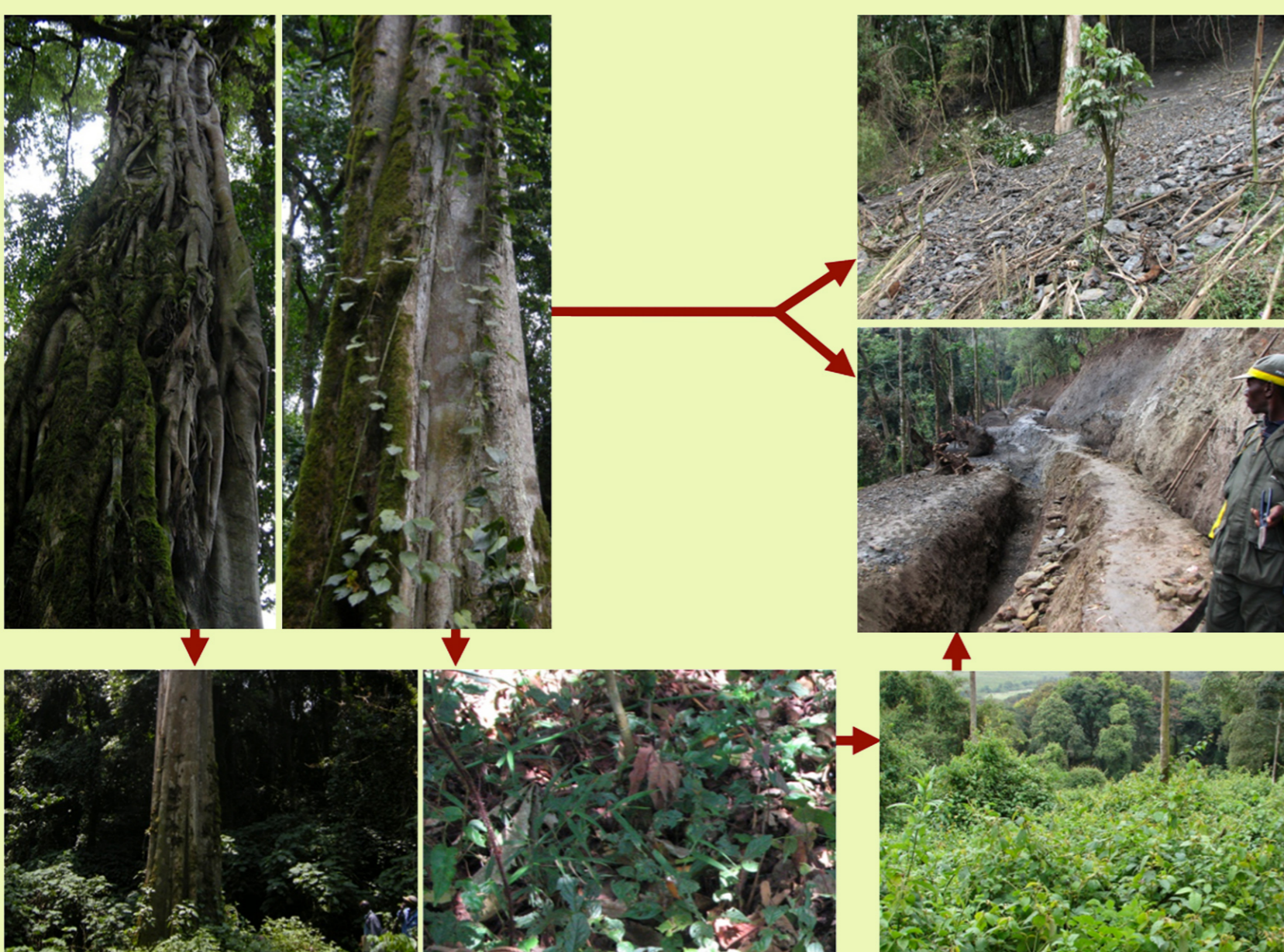
Schéma de la régression des habitats Des travaux de génie civil ou toute autre forme de défrichage, des érosions qui s'en suivent (glissements de terrain), etc. se passent brutalement en dégradant profondément les habitats que la nature a érigés très lentement.