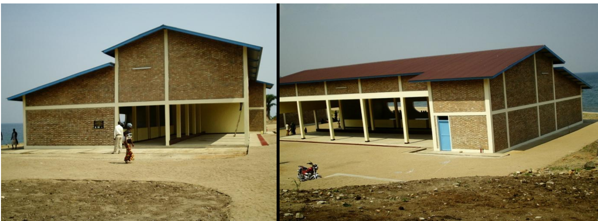
Photo: Débarcadères mis à la disposition des pêcheurs a Rutumo

Toutefois, il a été mis à la disposition des comités des pêcheurs des embarcations de surveillance de pêche sont encore en bonne états et sont bien entretenues par les comités des pêcheurs, sous la supervision de la fédération des pêcheurs.