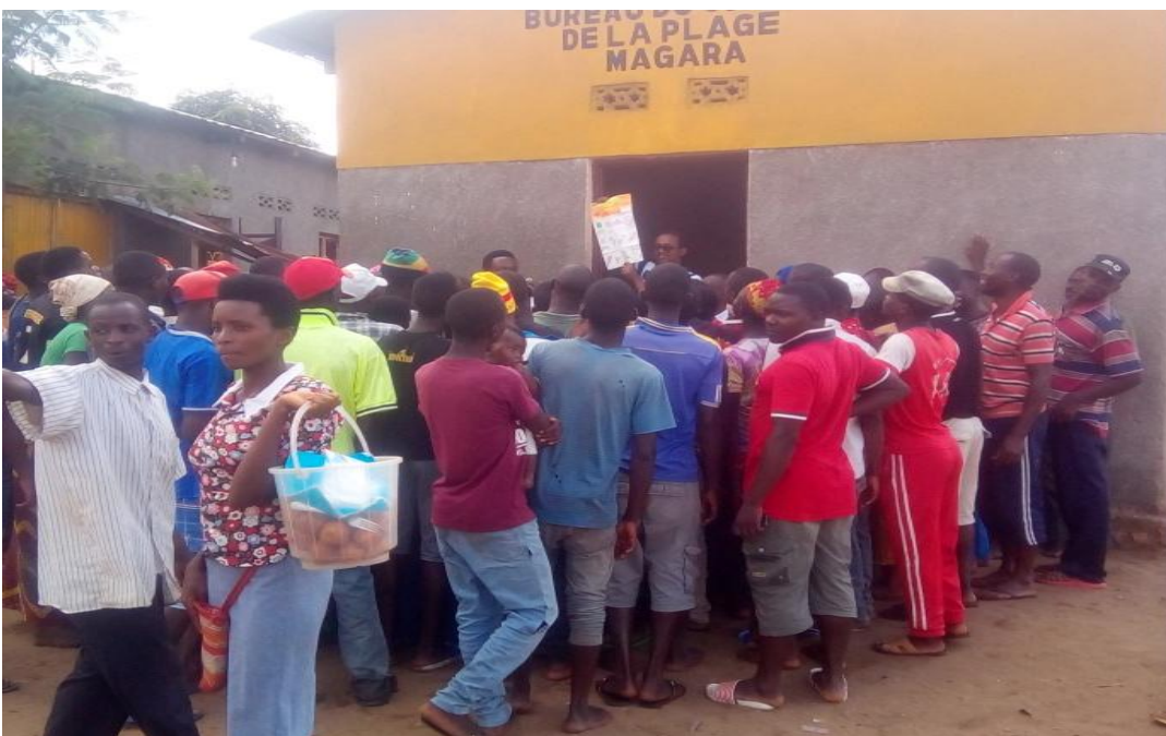
Photo: Séances de sensibilisation délocalisées au port de pêche de Magara

Il est à noter que les séances de sensibilisations délocalisées sur d'autres ports de pêche ont été menées par les techniciens du poste de soins en collaboration avec la fédération des pêcheurs.