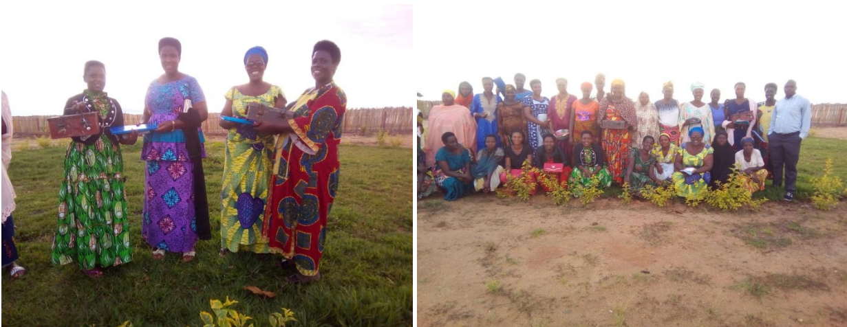
Photo : Femmes mareyeuses Abaremesha kiyago Photo du groupe

L'ONG SPARK en collaboration avec la fédération des pêcheurs ont pu organiser et former les femmes mareyeuses en associations et groupements sur l'épargne et crédit de temps plus que les membres de ces groupements font parties des communautés des pêcheurs