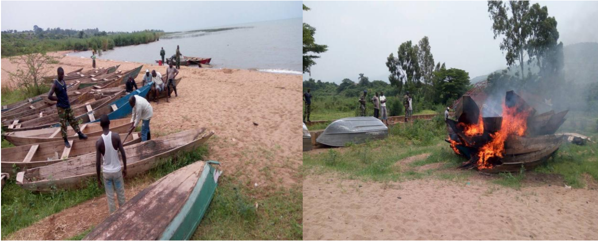
Photo : Destruction des bateaux éparpillés dans les sites clandestins le long du lac Tanganyika

Des réunions de sensibilisation en la matière ont été organisées par l'Administration en collaboration avec la fédération des pêcheurs, et plusieurs stratégies ont été arrêtées. C'est à cet effet qu'il a été organisé les rafles de lutte contre les sites clandestins le long du lac Tanganyika et le long des lacs du Nord.