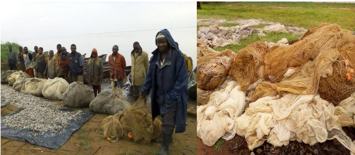
Photo : Filets illégaux de pêche saisis par les comités des pêcheurs en collaboration avec les Forces de l'ordre dans les lacs du Nord

Durant l'année 2017, les comités des pêcheurs sur les différents ports de pêche ont saisis et détruits plus de 5955 engins illégaux de pêche dont 153 sennes de plages, 79 filets maillants encerclant, 461 filets maillants mono filament (Kamusipi) et 5262 moustiquaires. Il est à noter que 5357 constitués des seines de plage moustiquaires et 480 kg de FMM ont été saisis dans les lacs du Nord (Rweru et Cohoha).