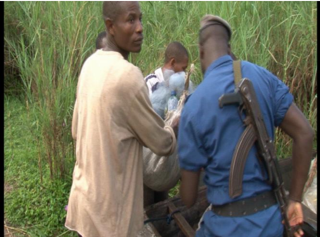
Photo : les forces de l'ordre en collaboration avec les membres des comites dans la lutte contre les engins illégaux de pêche