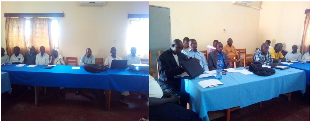
Photo : Réunion d'échange et de réflexion sur les frais des licences de pêche