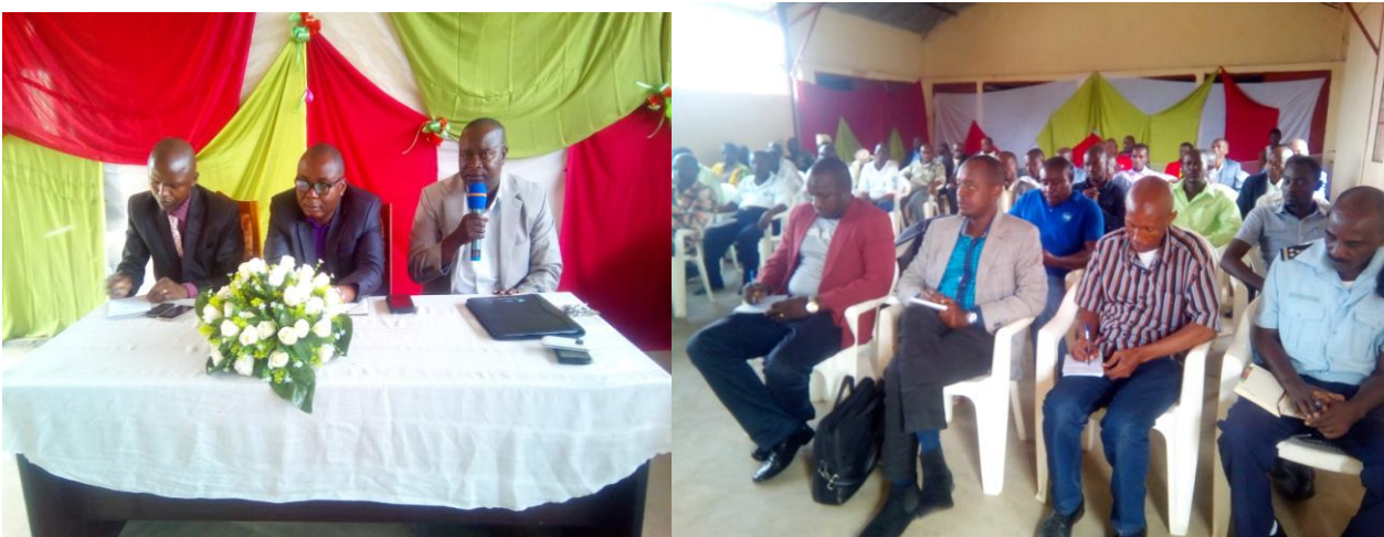
Photo: Les participants à la réunion de l'Assemblée générale de la fédération des pêcheurs FFPFB