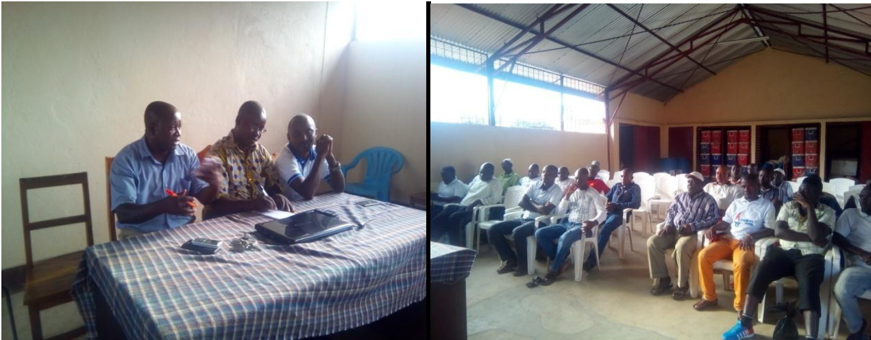
Photo : Réunion de sensibilisation des pêcheurs sur l'épargne et crédit