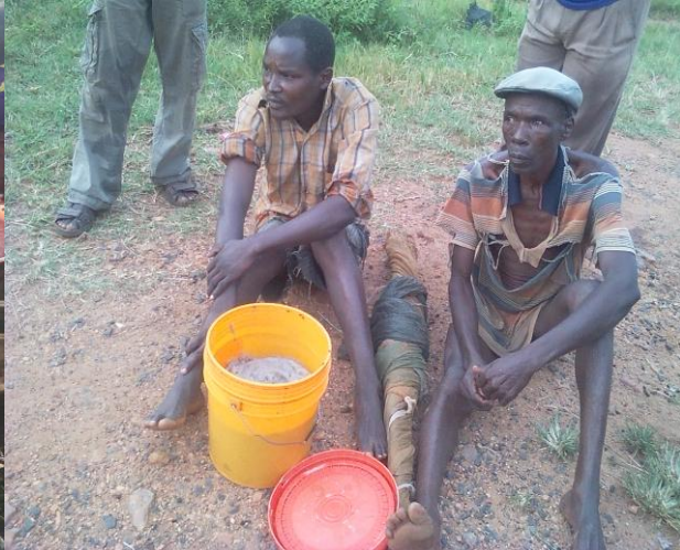
Malfaiteurs attrapés avec un saut d'alevins Umugara au port de pêche de Karonda