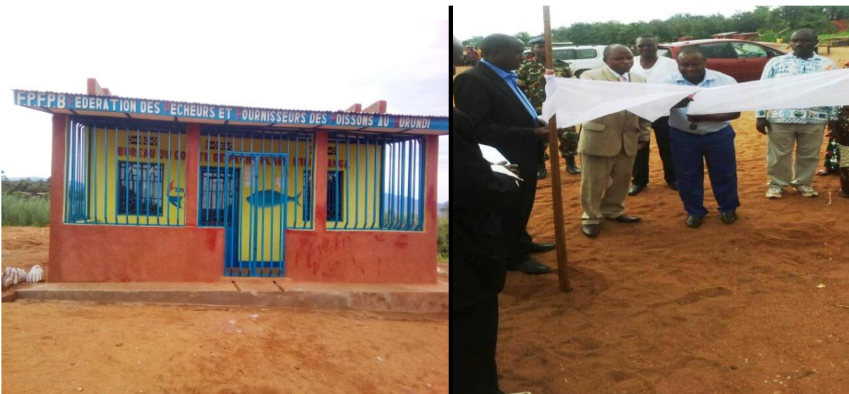
Photo : Inauguration du bureau comité de pêche de la plage Nyagatanga

En date du 23/12/2017 il ya eu inauguration du bureau du comité de pêche de la plage Nyagatanga par Monsieur le Directeur de la DEPA