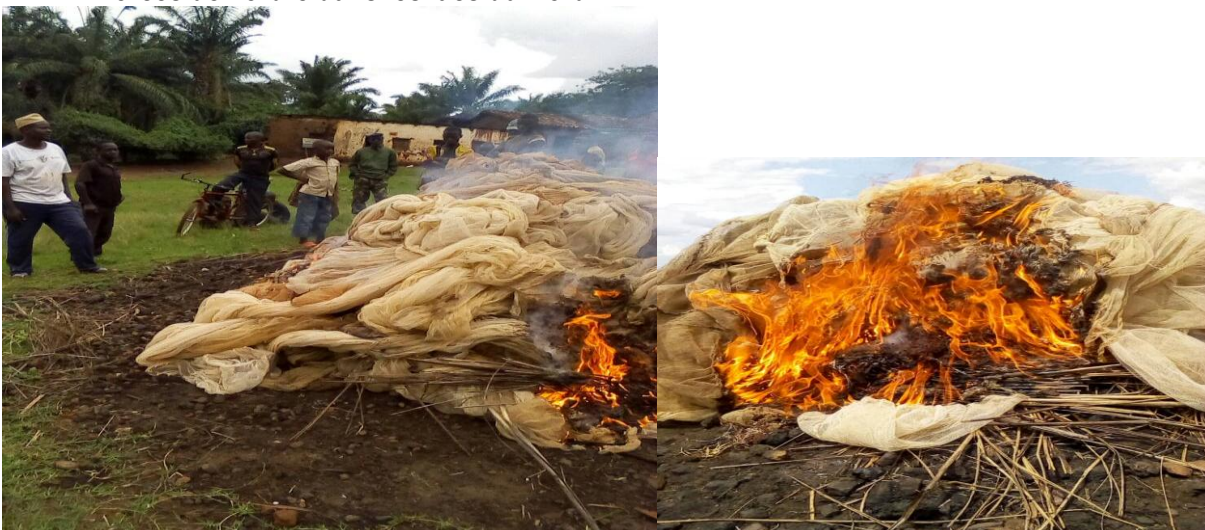
Photo : Destructions des engins illégaux de pêche saisis a la plage Nzove en commune de Giteranyi au lac Rweru