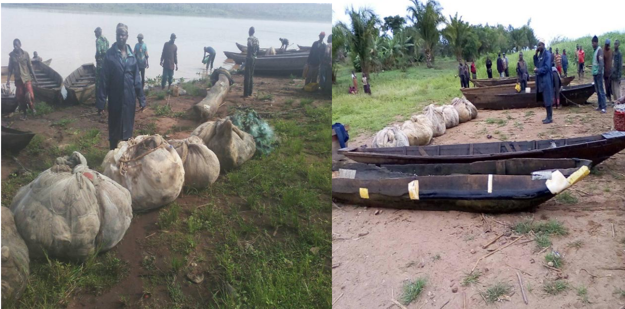
Photo : Les membres des comités des pêcheurs de Nzove commune Giteranyi en collaboration avec la marine Burundaise dans une surveillance des pêches

Des patrouilles de surveillance des zones de reproduction ont été menées par les membres des comités des pêcheurs afin de préserver les zones protégées identifiées pour la reproduction des poissons.