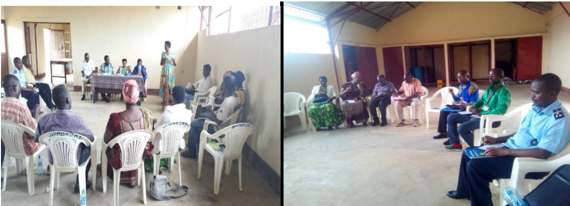
Photo: Atelier de sensibilisation sur la lutte contre les violences basées sur le genre en milieu de pêche