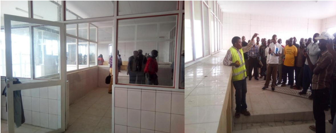
Photo : Centre sous régional de traitement des produits de la pêche au débarcadère de Rutumo

Toutefois le centre n'est pas connecté aux réseaux de raccordement en eau et électricité mais les démarches sont en cours. Signalons qu'un contrat d'aménagement de ce centre a été signé entre le SPARK- la DEPA et la fédération des pêcheurs FPFPB.