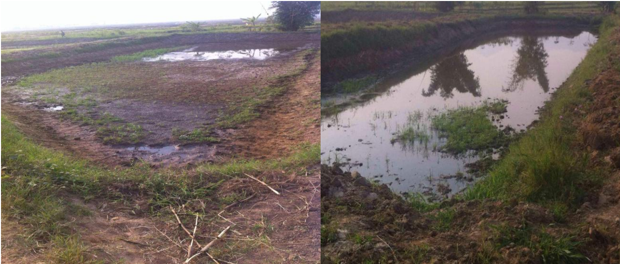
Photo : Etat des lieux des étangs piscicoles de Mubone avant sa réhabilitation

Afin de réduire l'effort de pêche sur le lac Tanganyika des activités alternatives à la pêche ont été mis en place par la DEPA en collaboration avec la fédération des pêcheurs. A cette fin, les étangs piscicoles de Mubone ont été mis à la fédération des pêcheurs pour la gestion et la rentabilisation.