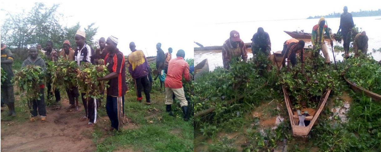
Photo : les travaux de la lutte contre la jacinthe d'eau aux ports de pêche

Dans le souci de préserver l'environnement du lac Tanganyika et sa biodiversité des travaux communautaires d'arrachage manuel ont été organisées par la fédération en collaboration l'administration dans le but de lutter contre les espèces envahissantes au port de pêche (jacinthes d'eau).