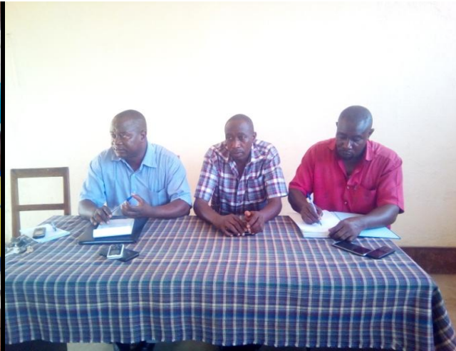
Le président de la Fédération en train de former les membres des comites des notion de la résolution pacifique des conflits.