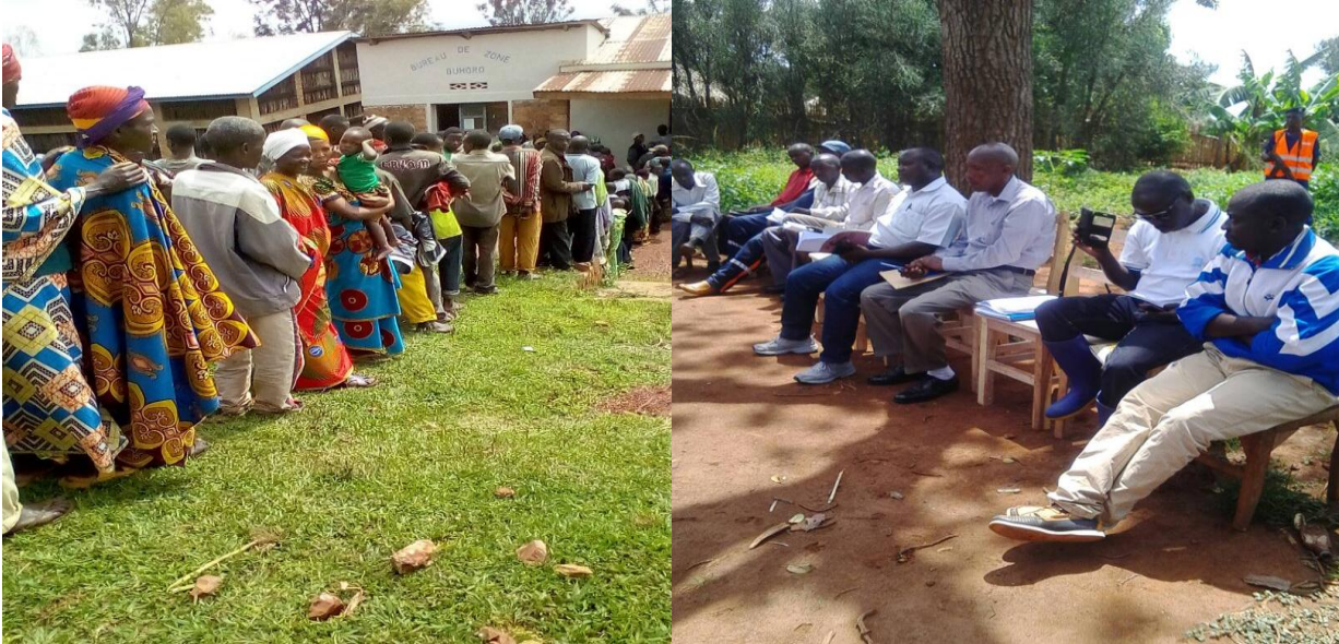
Photo : La mise en place des comités des pêcheurs dans les lacs du Nord