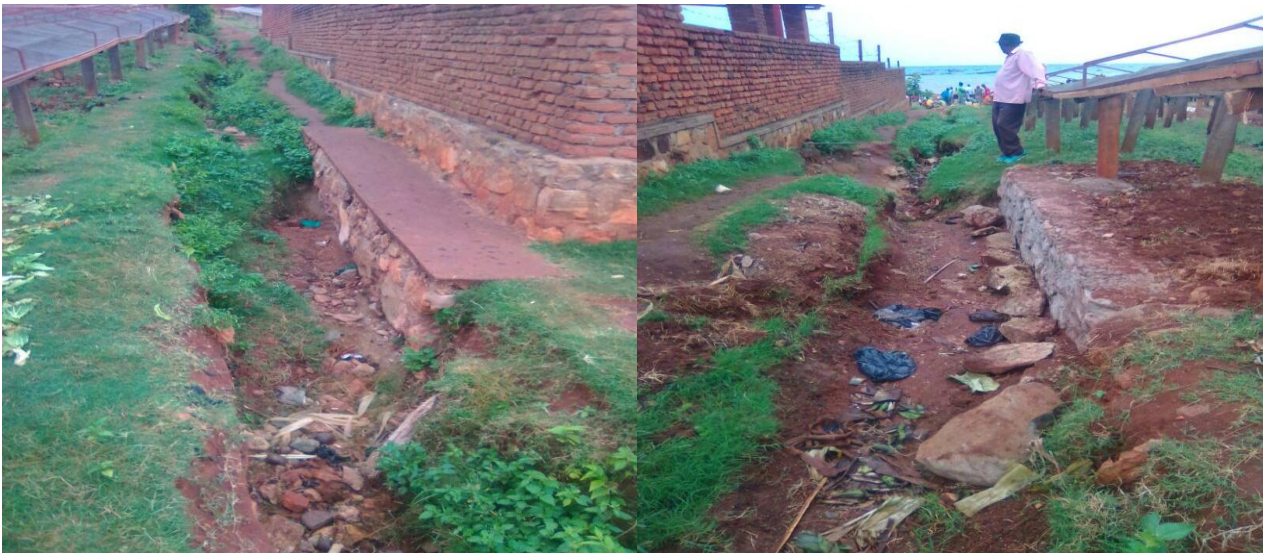
Photo : Erosion tout près du centre pilote de Mvugo

Dans le but de pérenniser les acquis du projet, le centre de pêche pilote de Mvugo qui était en ruine a été réhabilité par la Fédération.