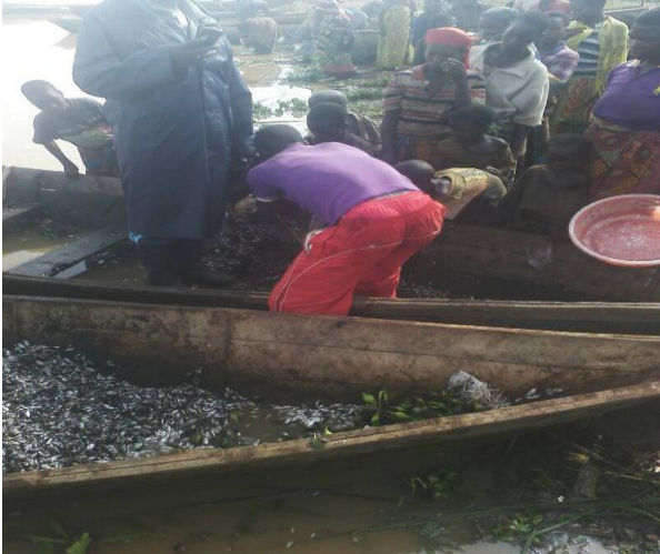
Photo : Les alvins des poissons attrapés par membres des comités des pêcheurs de Giteranyi