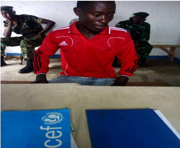
Photo : Un rescapce du meurtre perpétré par des voleurs armées congolais en l'encontre des pêcheurs burundais dans les eaux de pêche de Kizuka en date du 12/11/2017

Il est à signaler que durant cette année il ya eu 23 pertes des vies humaines par noyades causées par les vents violents dues au changement climatique. Toutefois 4 de ces pertes des vies ce sont des pêcheurs burundais qui ont été tués par les pêcheurs congolais utilisateurs des filets de pêche prohibees.