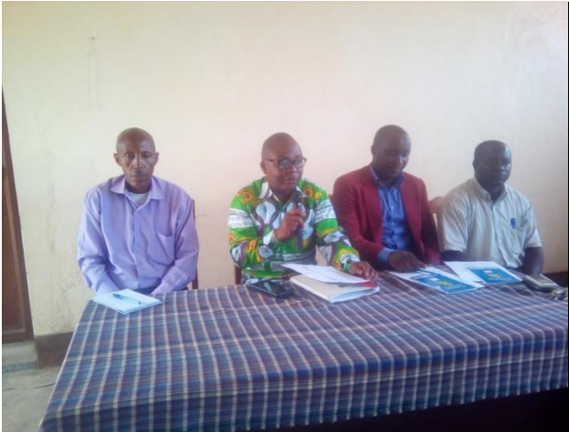
Photo : Gouverneur de la Province de Rumonge dans la réunion de vulgarisation de la nouvelle loi régissant la pêche et l'aquaculture au Burundi

Dans le secteur de la pêche toutes les parties prenantes travaillent en synergie.