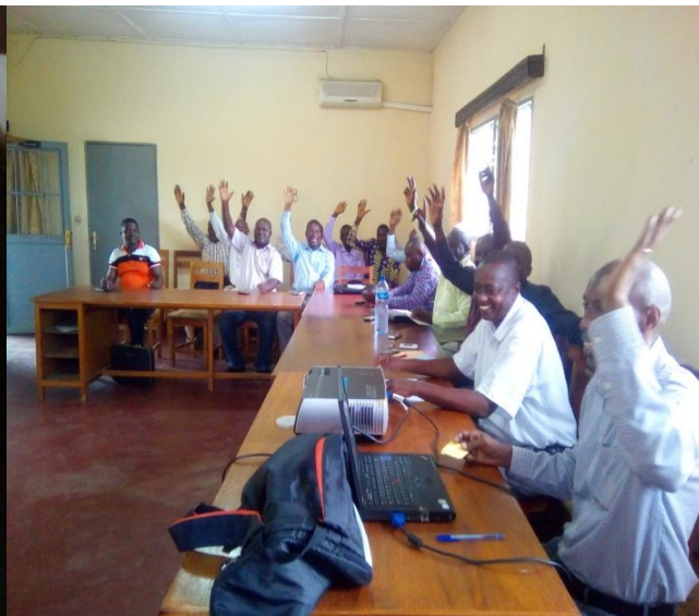
Photo : Validation du calendrier des pêches 2017 par les représentants des comités des pêcheurs