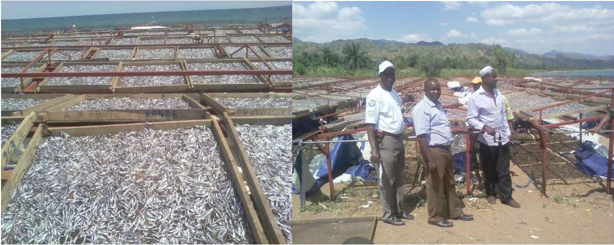
Photo : Les claies de séchage bien entretenues au port de pêche de Kabonga