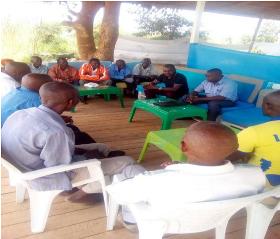
Photo : Résolution pacifique des conflits au port de pêche de Kanyosha