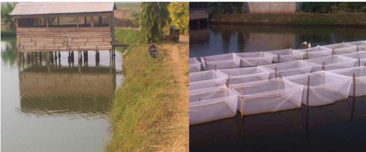
Photo : Etat actuel des étangs piscicoles de Mubone (Les alevins dans les Happas)

Il est à noter qu'après la réhabilitation qui a coûté à la fédération des pêcheurs plus de 15 403 000 Fbu ces étangs sont en bon état et ils sont fonctionnels pour la disponibilité sur le marché national des poissons et alevins de bonne qualité à un prix accessible à la population.