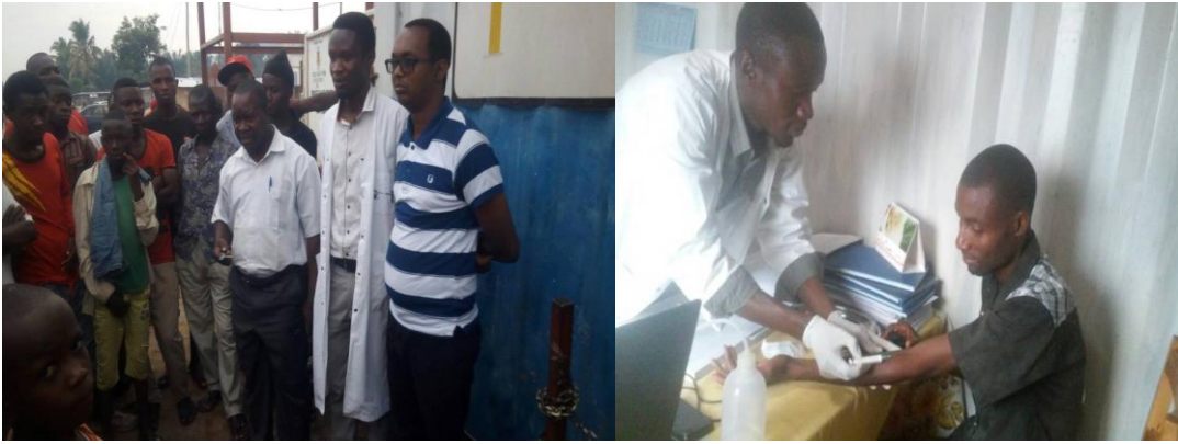
Photo: Séances de sensibilisation et le dépistage volontaire au port de pêche de Rumonge