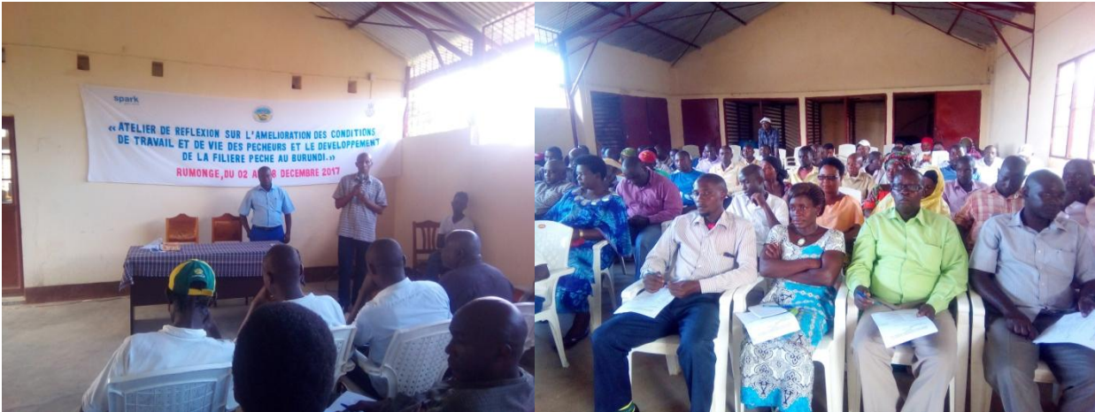
Photo : Atelier de réflexion sur l'amélioration des conditions de travail et des vies des pêcheurs et le développement de la filière pêche au Burundi, organisé par le SPARK en collaboration avec la fédération