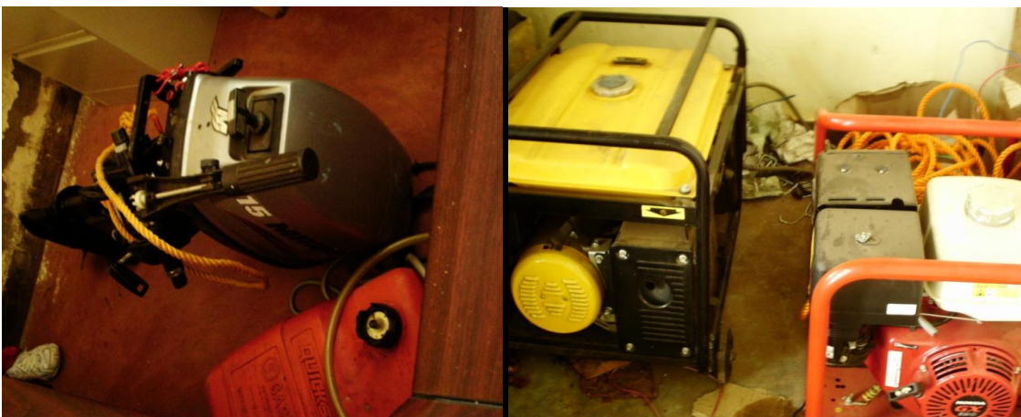
Photo: Moteurs-Hors-bord et Groupe électrogènes bien entretenues

Toutefois, il a été mis à la disposition des comités des pêcheurs des embarcations de surveillance de pêche sont encore en bonne états et sont bien entretenues par les comités des pêcheurs, sous la supervision de la fédération des pêcheurs.