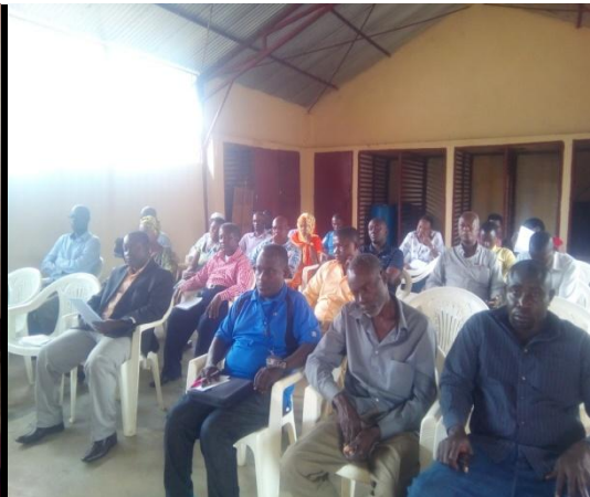
Photo : Atelier de sensibilisation des pêcheurs sur la nouvelle loi régissant la pêche au Burundi