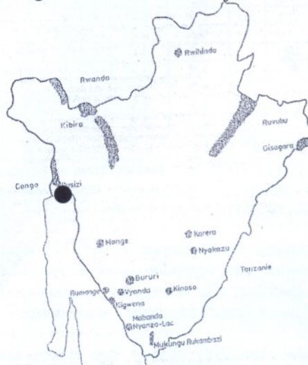
Fig. 1 : Aires protégées du Burundi (Secteur Delta, en noir)

Pour analyser les modes d'exploitations de cette espèce d'Amphibien, des enquêtes ont été menées, une dans les zones périphériques de la Réserve Naturelle de la Rusizi et une autre dans les hôtels et restaurants préparant et servant les cuisses de grenouilles en ville de Bujumbura.