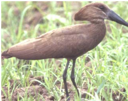
Ombrette africaine Scopus umbretta