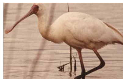
Threskiornithidae Platalea alba