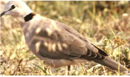
Streptopelia capicola Ighugugu