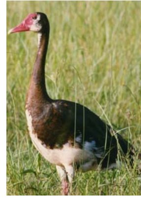
Imbata Plectrosperus gambensis