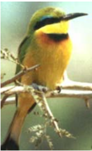
Merops variegatus Umusamanzuki