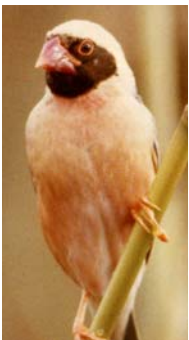
Travailleur à bec rouge Quelea quelea