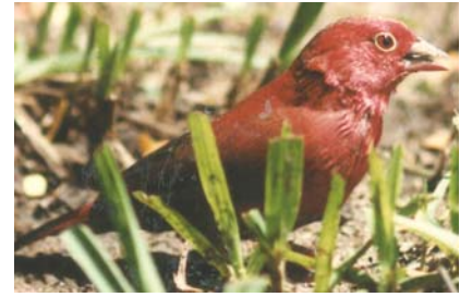
Lagonosticta senegala Ifundi