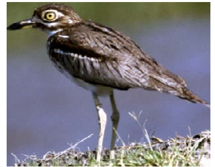
Inkorikori Burhinus vermiculatus