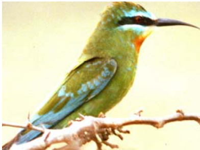
Merops persicus Umusamanzuki