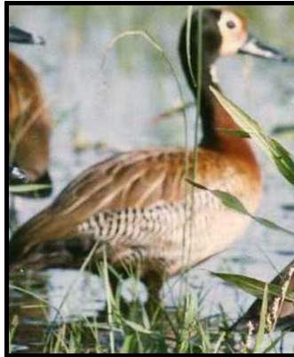
Imbata Dendrocygna viduata