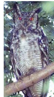
Grand-Duc africain Bubo africanus