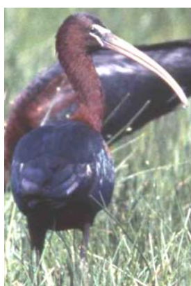
Threskiornithidae Plegadis falcinellus