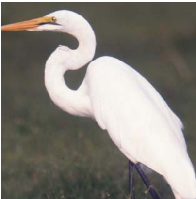
Ikirovyi Egretta alba