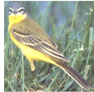
Motacilla flava Inyamanza