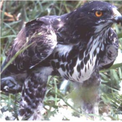
Inkona Hieraaetus dubius