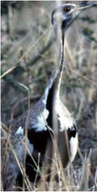
Outarde à ventre noir Eupodotis melanogaster