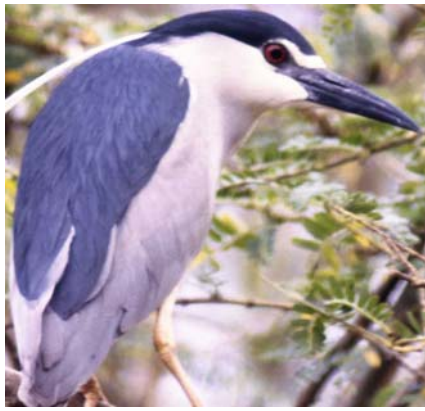
Ikirovyi Nycticorax nycticorax