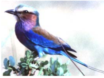
Coracias caudata Inganzabisiga