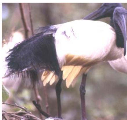
Threskiornithidae Threskiornis aethiopicus