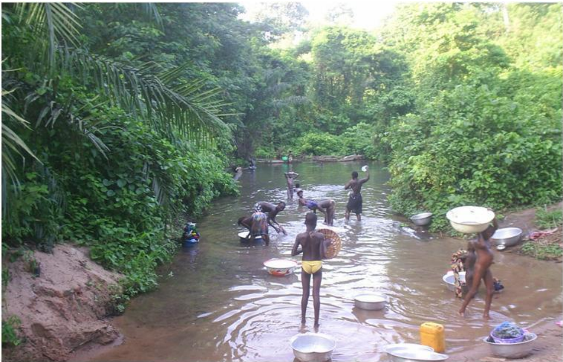
Photo 6. Sources d'eau protégée par une forêt sacrée