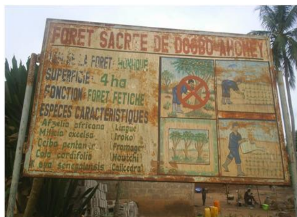
Photo 4 : Quelques actions de sensibilisation sur la conservation des FS interdisant la pratique de l'agriculture dans le domaine de la FS