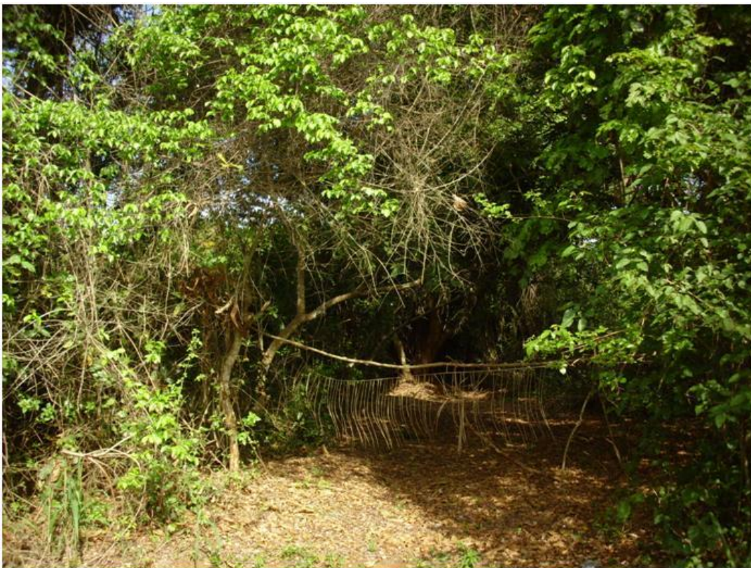
Photo 8 : Protection de l'entrée d'une FS par les rameaux de plamier