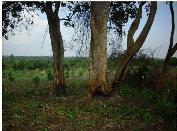
Photo1: Dernier assaut contre une FS remplacée par un champ de maïs dans le Couffo