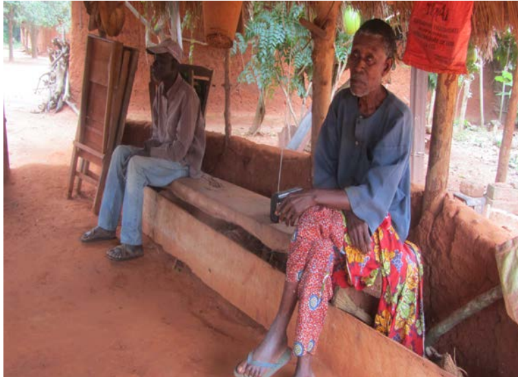
Photo 2: Chef de la collectivité Beïssan, gestionnaire de la FS Dantonou Lokoghoué