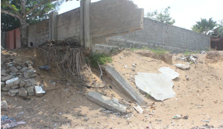
Plage de Donatein, Erosion côtière