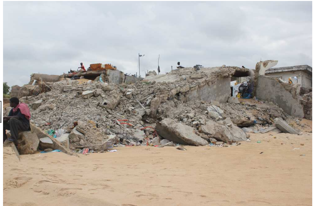
Plage de Donatein, Aout 2014