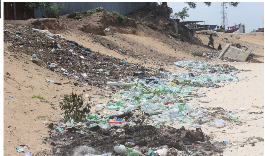
Zones Humides et plages polluées