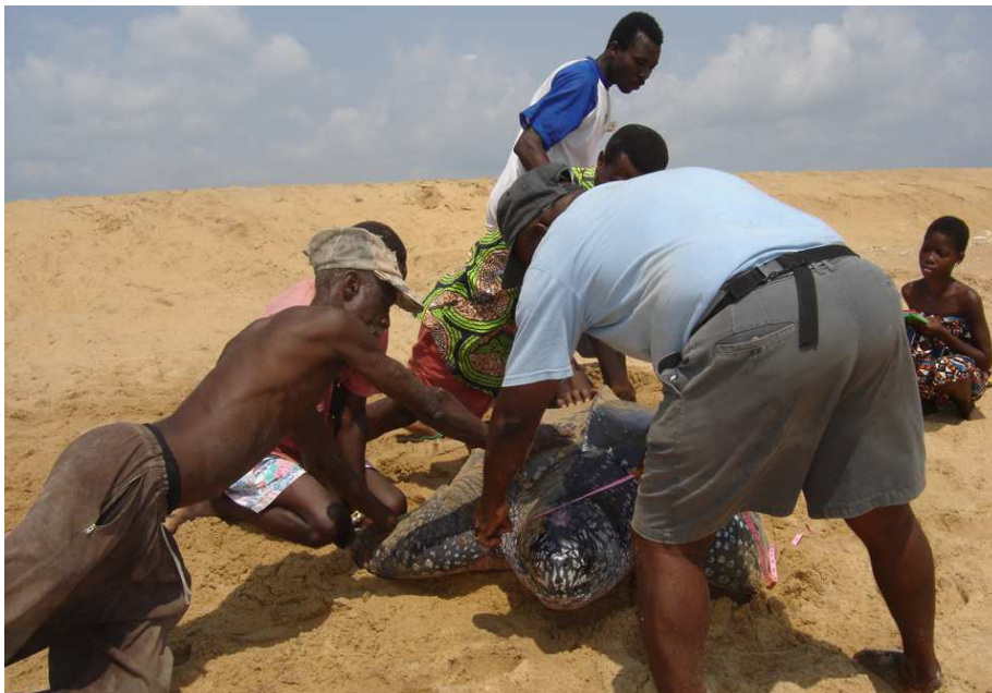
Mensurations et baguage d'une tortue luth sur la plage au Bénin

6 /11/2004, une Luth, Dermochelys coriacea (Vandelli, 1761) vient pondre sur la plage de Donatein (06°21'09 N / 02°27'21E) au Bénin, dans le Golfe de Guinée (Afrique Occidentale). Perturbée par la présence humaine, elle n'a pas pondu. Les Ecogardes de la région formés par Nature Tropicale ONG ont réussi à épargné cette tortue du massacre et ont pu la marquer avec une bague Monel numéro BJ 0124 avec l'adresse Musée SCI Naturelles 06 BP 1015 PK3 COTONOU BENIN.. Elle a été capturée accidentellement par un chalutier participant au Programme de collecte de données à bord (PROMACODA) le 21/12/2009 au large de Rio de la Plata (35°30' / 55°58' - 56°09'), en Uruguay. Une autre tortue Luth non baguée a également été capturée. Malheureusement, les deux tortues ainsi capturées ont été noyées et sont mortes. Une grande découverte, une importante preuve de la grande migration des tortues marines de l'Atlantique entre les côtes Africaines et celles Américaines.