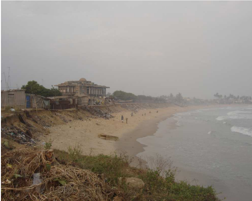
Plage de Donatein, Décembre 2005