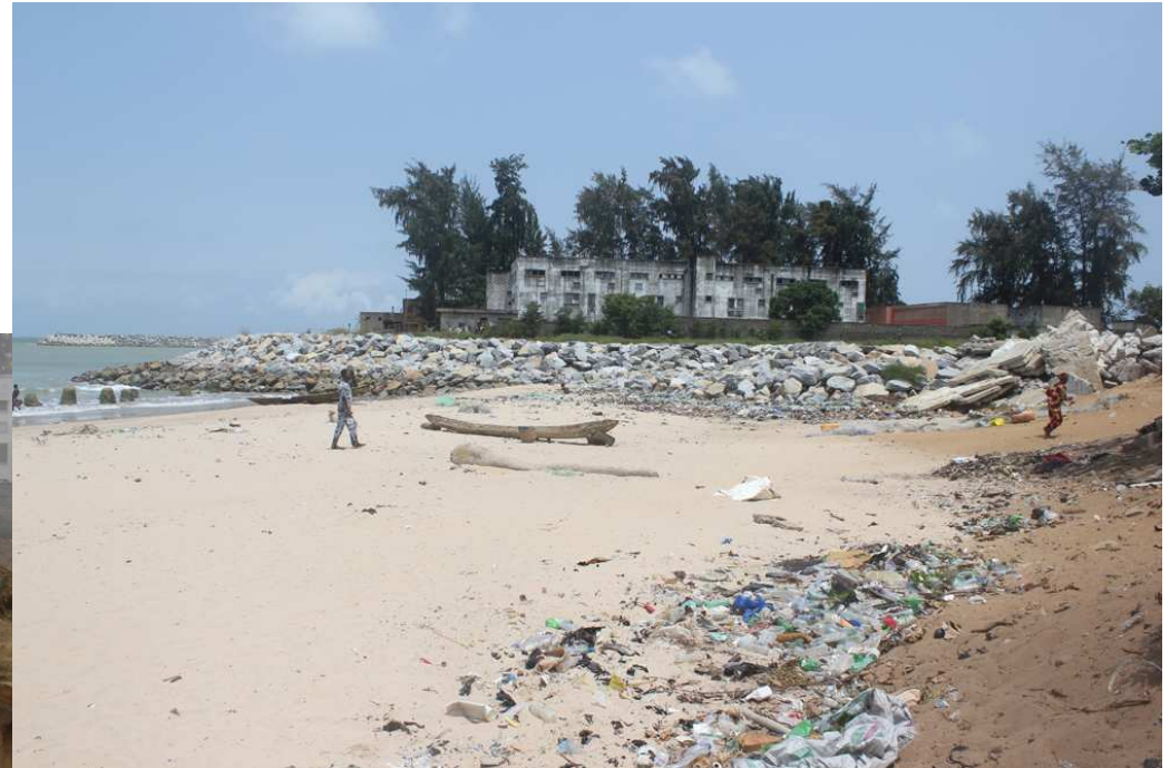
Plage de Donatein, Juin 2015