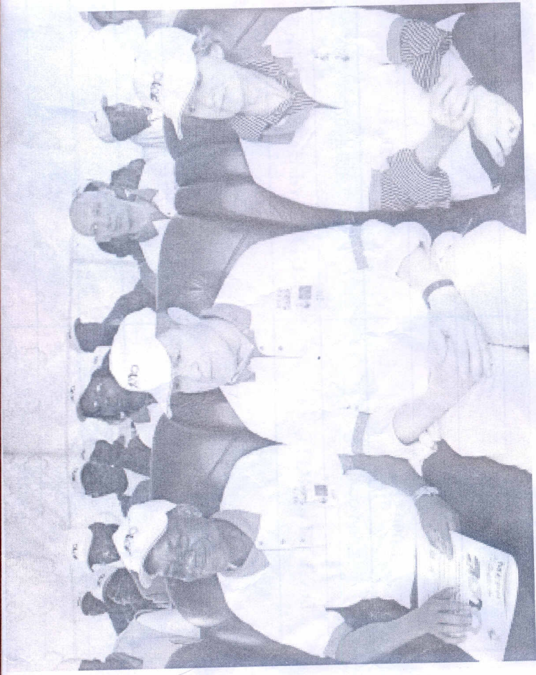
Vue partielle des officiels au lancement de la journée...