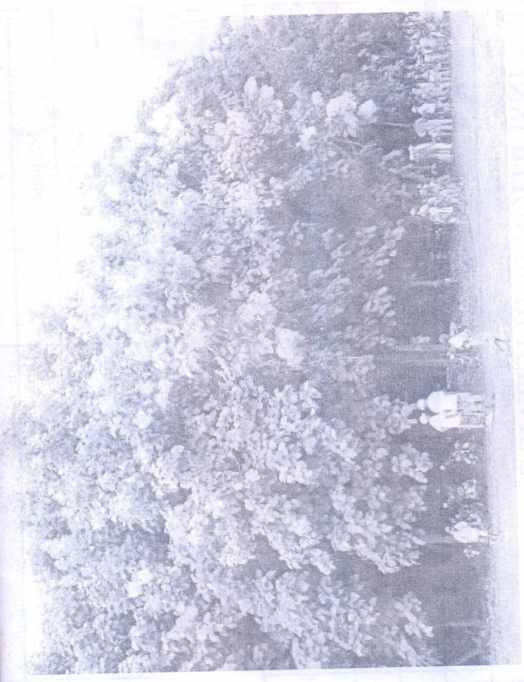
...d'action sur la diversité biologique.