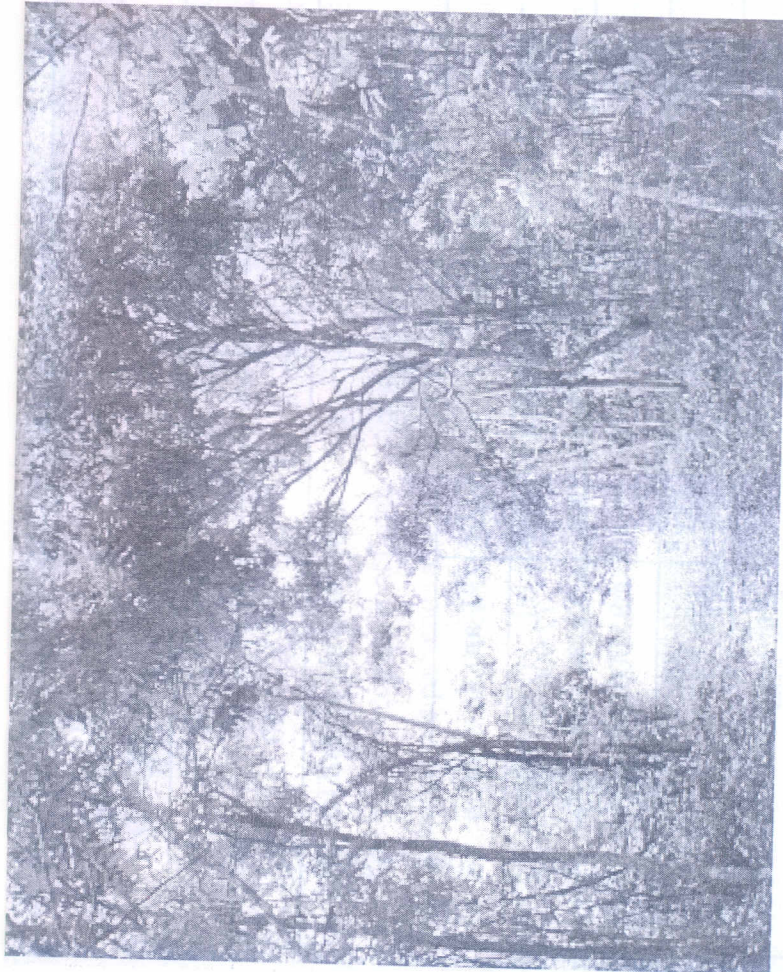
Une vue du circuit écologique long d'un Km et demi.