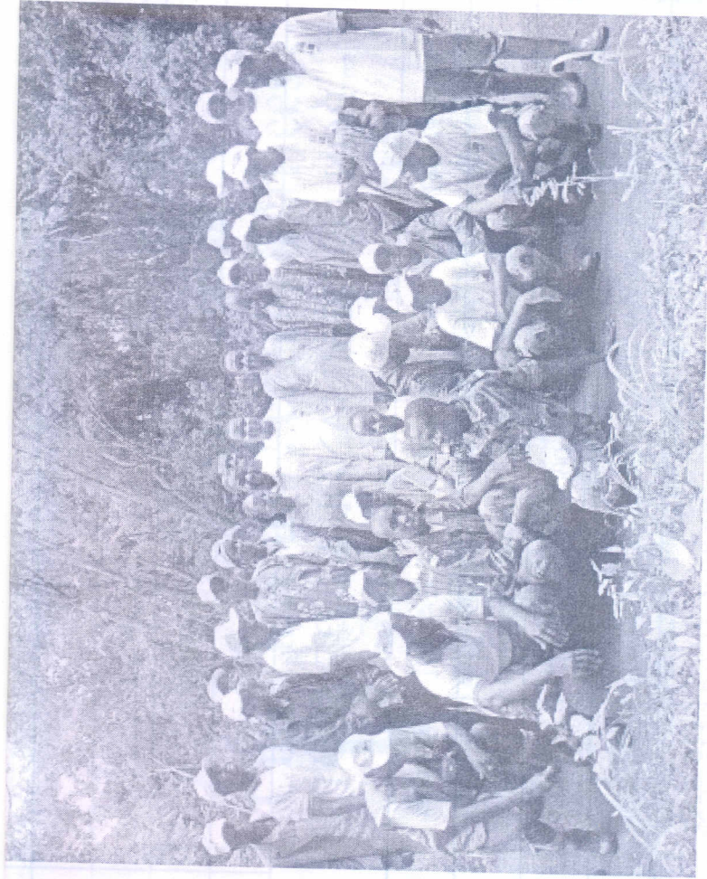
Les randonneurs au terme du circuit pédestre.

Le Caribou N°004 du Mercredi 09 Juin 2010 "Bien Faire & Laisser Braire"