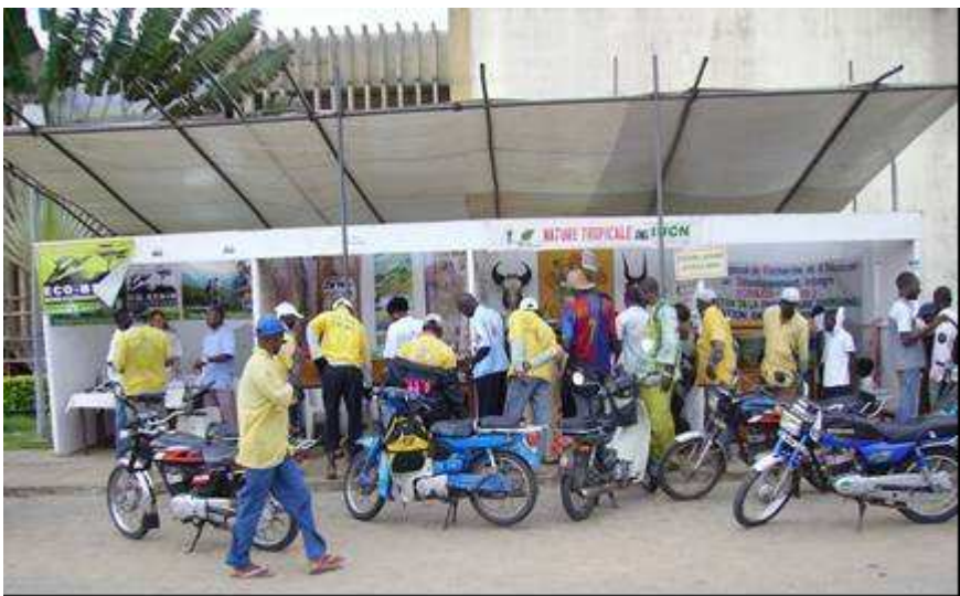
Attraction du public par les expositions de la troisième Semaine Nationale des Aires Protégées