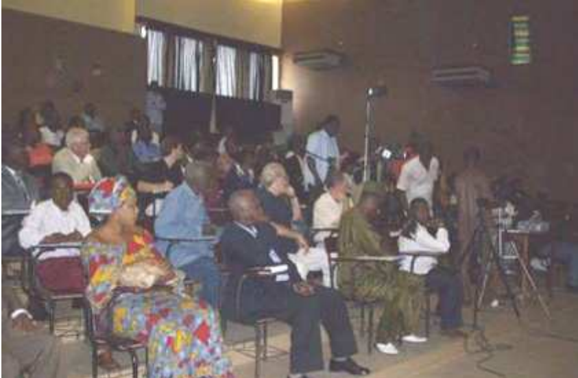
Vue des participants aux communications scientifiques et techniques