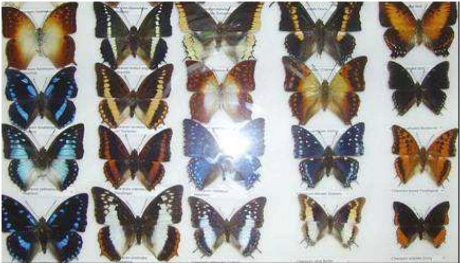
Exposition de la collection du Musée des insectes de l'IITA, Bénin