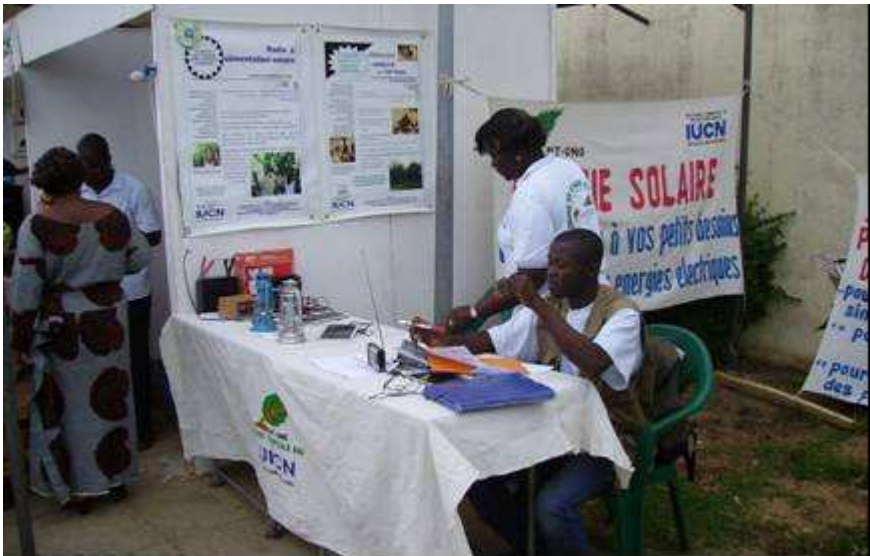
Exposition et promotion de l'énergie solaire (énergie propre)