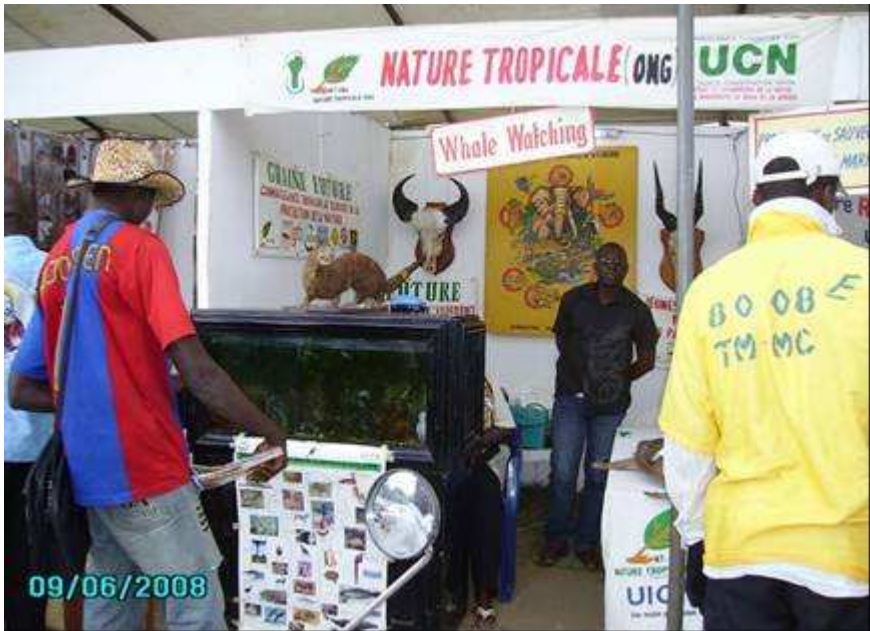
Exposition d'animaux empaillés et aquarium.