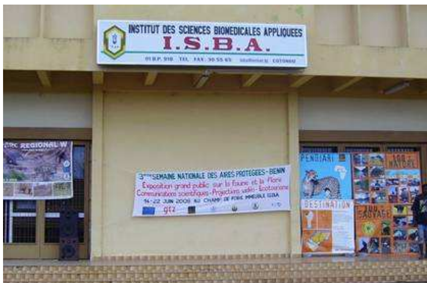
Façade de l'Institut des Sciences Biomédicales Appliquées ayant abrité la troisième Semaine des Aires Protégées, du 15 au 22 juin 2008.

Les premières manifestations qui ont marqué la troisième Semaine Nationale des Aires Protégées ont démarré le 14 juin 2008 avec des expositions de trophées, d'animaux vivants et empaillés, des photos et des posters. Ces manifestations jusqu'au soir du 22 juin 2008, sont constituées d'expositions, de projections régulières et continues de films sur les aires protégées. Quelques photos ci-dessous évoquent les manifestations.