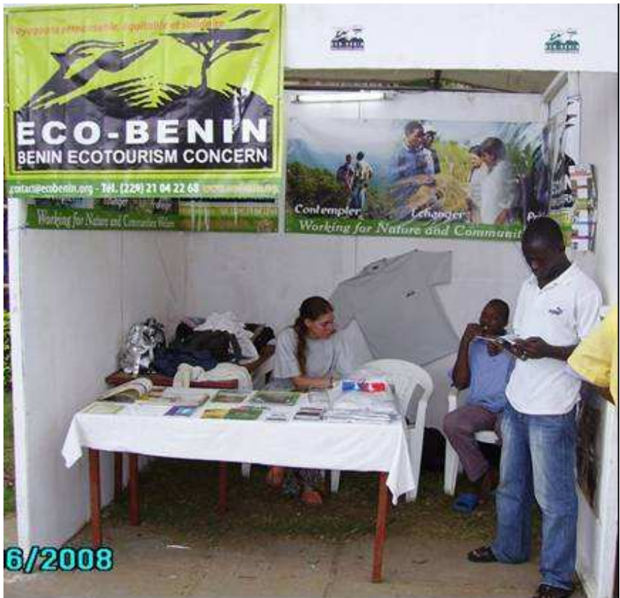
Valorisation de l'écotourisme