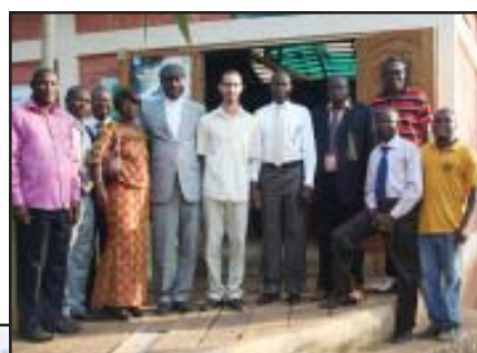
Visite du maire d'Abomey-Calavi et son homologue de Bangui (Centrafrique)

* Renforcer le dispositif de gestion communautaire de la vallée du