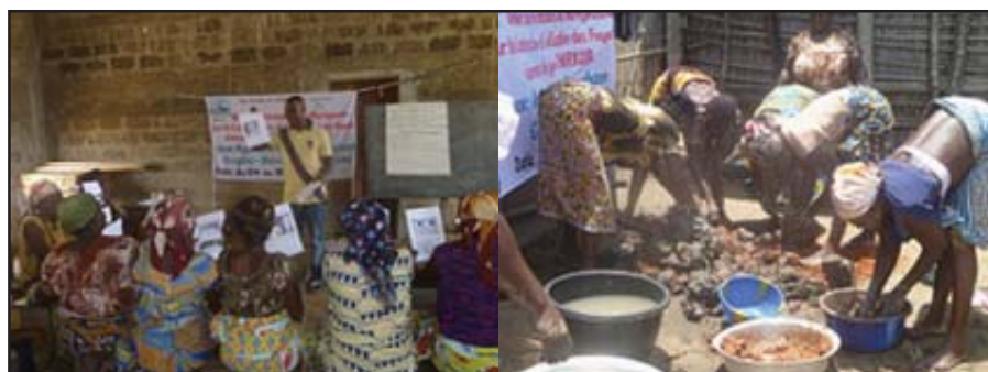
Formation des mareyeuses sur les techniques durables de fumage des produits de pêche et la construction des foyers économes de type "chorkor"

AquaDeD ONG entend nouer de partenariat avec les ONG de Ecosystem Alliance, du Forum Biodiversité et du Réseau GAWA; avec les Ministères de l'Agriculture, de l'Environnement, de l'Eau, et leurs directions techniques associées; avec les Universités et Centres de recherche et développement nationaux et internationaux; et avec les projets et programmes sectoriels. ■