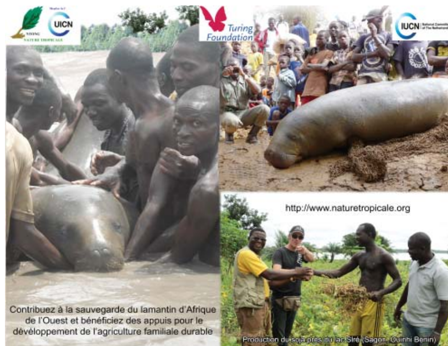
Contribuez à la sauvegarde du lamantin d'Afrique de l'Ouest et bénéficiez des appuis pour le développement de l'agriculture familiale durable

Les activités à mener par Nature Tropicale ONG dans le cadre du Programme Ecosystem Alliance sont basées sur la mise en œuvre du Projet de Gestion intégrée du Lamantin d'Afrique dans la Vallée de l'Ouémé et la coordination de Ecosystem Alliance au Bénin. ■