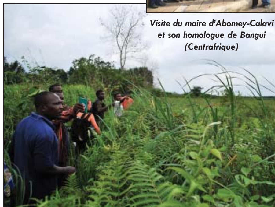
Chasseurs de la Vallée du sitatunga et l'équipe de CREDI-ONG au coeur de la réserve