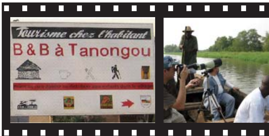
L'écotourisme comme pilier économique du développement