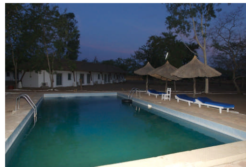
Hôtel de la Pendjari où aura lieu la 3 e réunion de l'OGRAN